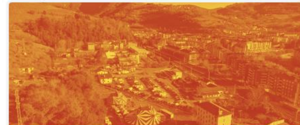
5. San Esteban